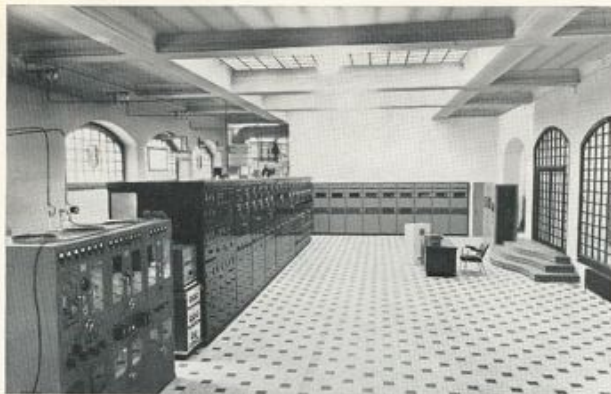
LA SALLE DES EMETTEURS