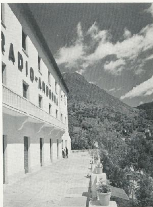
STUDIOS ET ADMINISTRATION (ANDORRE LA VIEILLE)

watts - 300 m - 998 kcs - 200.000 watts - 300 m - 998 kcs - 200.000 watts -