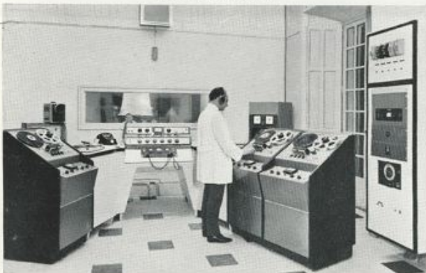
UNE CABINE TECHNIQUE