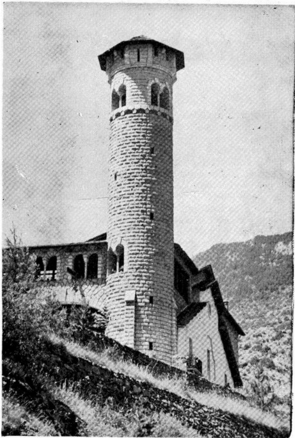
RADIO ANDORRA. La plus ancienne station des Vallées.