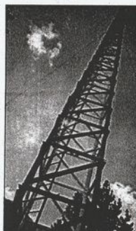
L'antena, en un triptic.