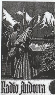
Publicitat de Ràdio Andorra.

A França va ser l'única emissora privada independent durant la Segona Guerra Mundial i corria el rumor que els equips d'emissió havien estat regalats per Goebbels el 1939.