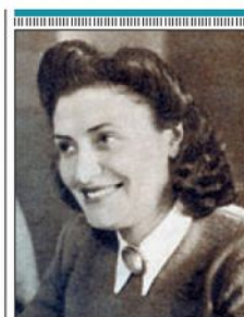
▶▶ La celebritat > Zorzano.