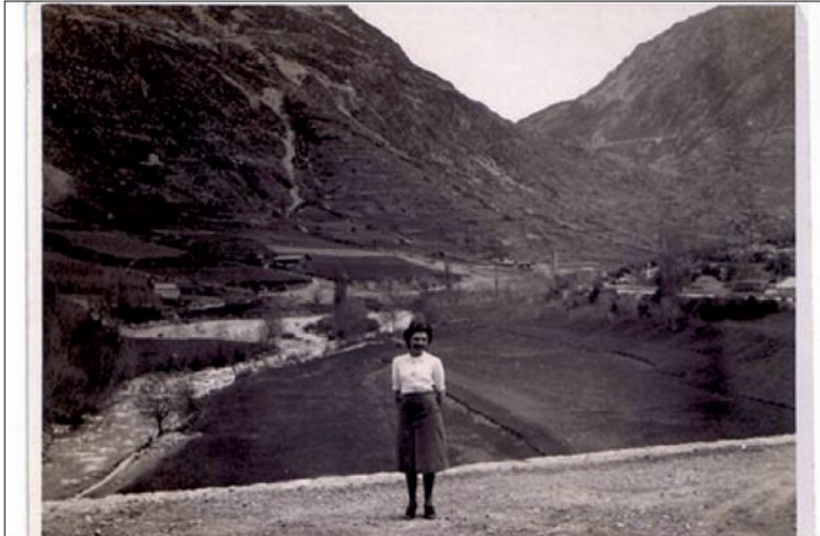
▶▶ Locutora pionera > Escrihuella va ser la primera veu a parlar pels micròfons de Radio Andorra.

'La vida de tu m'allunya, però et sentiré al meu costat. / I quan seré a Catalunya/ recordaré les besades que t'he dat'